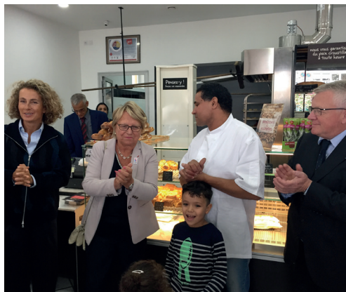
> Inauguration de la boulangerie-pâtisserie des Grèves - 233, rue du Président Salvador Allende