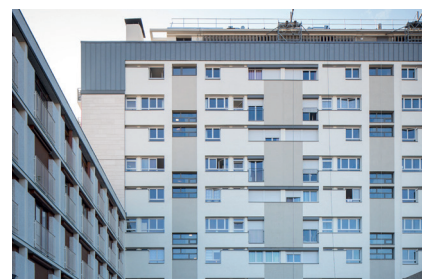
> Nouvelle façade