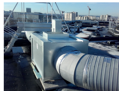
> Remplacement des caissons VMC Résidence Victor Basch