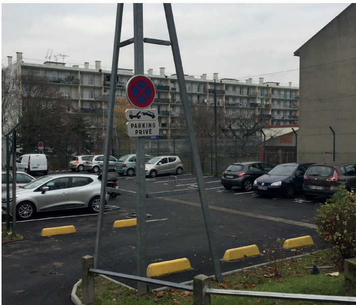
> Nouveau parking - 234, rue Saint-Denis

La question du stationnement est une préoccupation quotidienne pour les locataires. Colombes Habitat Public travaille à trouver de nouvelles solutions partout où c'est possible et a pris des mesures fortes pour réduire le problème du stationnement gênant et des dégradations.