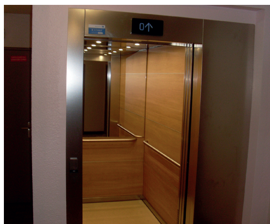
> Nouvel ascenseur au 54 rue de l'Industrie