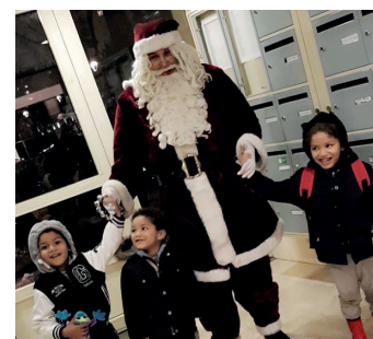
> Balade du Père Noël aux Fossés-Jean