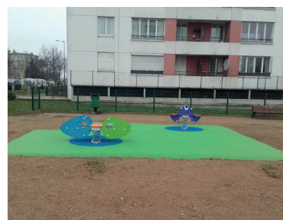
> Aire de jeux - 26 avenue Audra (après)