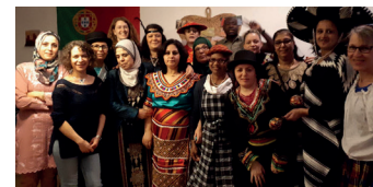
> Concert de musique au monde au 5-7, rue d'Orgemont avec l'Amicale Arc-en-Ciel

Pour les fêtes de fin d'année, CHP a programmé des animations pour ses locataires en quartiers prioritaires : balade du Père Noël dans les résidences et découverte de sa « Fabrik » ; ateliers créatifs, chuchoteur d'histoires et jeux de société et de stratégie... Avec les Amicales, des spectacles et des concerts ont été offerts aux locataires, petits et grands. L'aide des gardiens a grandement participé au succès de ces animations.