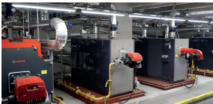
> Nouvelle chaufferie du 45 rue Jules Michelet

Des investissements sont encore prévus en 2018.