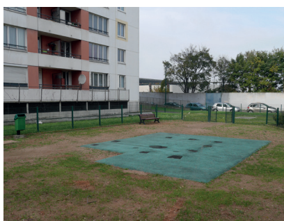
> Aire de jeux - 26 avenue Audra (avant)