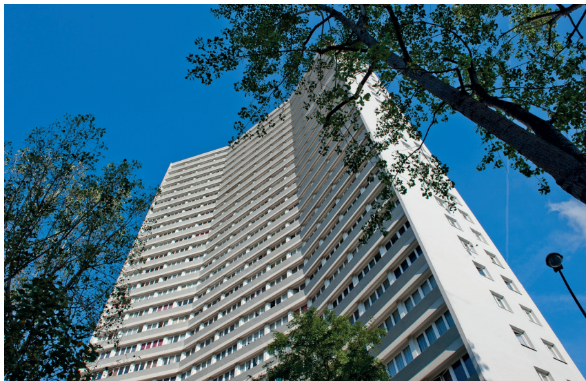
> Tour Z actuellement