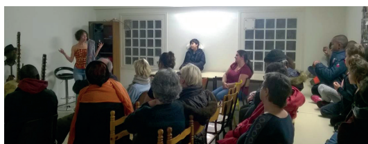
> Concert au 239, rue S.Allendé avec l'Amicale Mieux vivre aux Grèves