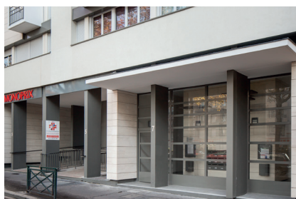
> Nouvelle façade