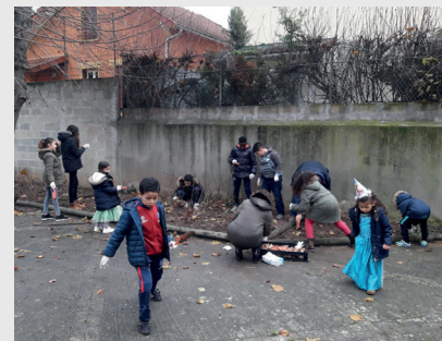
> Les enfants de la résidence des Toits Verts en plein jardinage