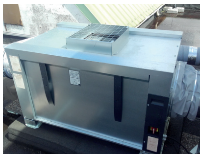
> Remplacement des caissons VMC Résidence Jean-Jacques Rousseau